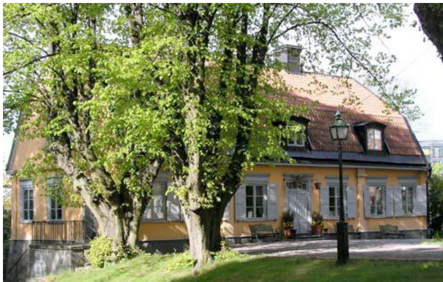
Lilla Frösunda 1700-talsherrgård.