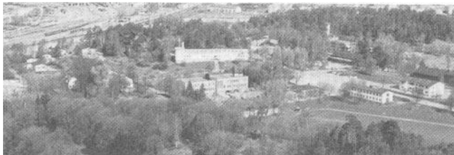
Lilla Frösunda med tjänstebostäder och herrgården till vänster, kaserner, skola, kanslihus i centrum och Speldosan, Hilton m.m. till höger i bilden.